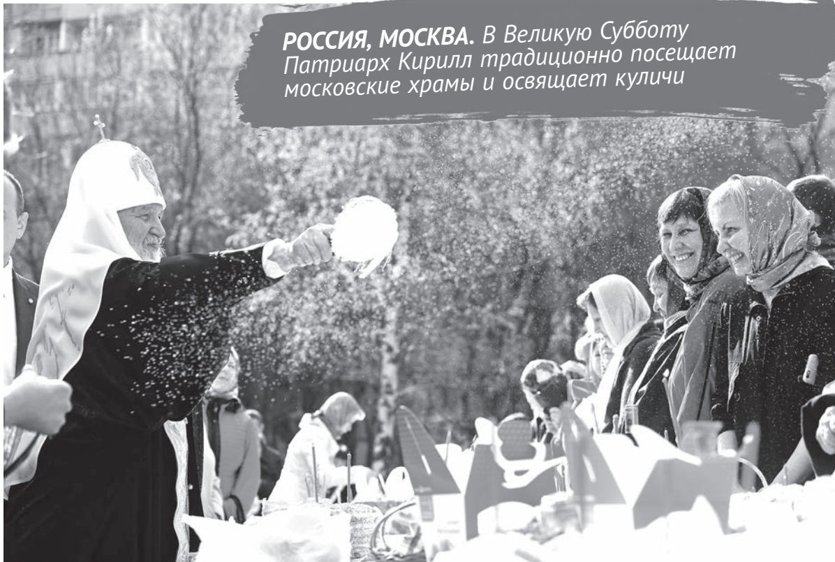
РОССИЯ, МОСКВА. В Великую Субботу Патриарх Кирилл традиционно посещает московские храмы и освящает куличи

Воскресение Христово говорит нам о принципиально ином состоянии, в котором воскресает Спаситель и в которое будет воскрешен каждый из людей, как веруют христиане. Эта особенность воскресения в славянском языке передана очень интересно. Слово «воскресение» происходит вовсе не от корня «крест», как иногда может показаться, а от глагола «кресать» (или «кресить»), то есть