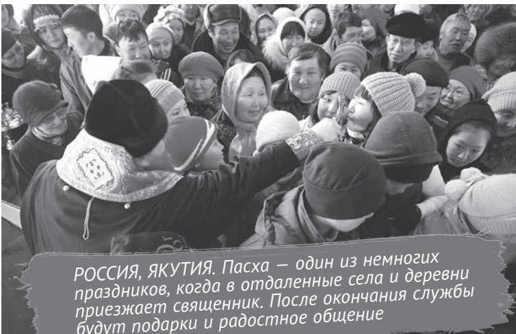
РОССИЯ, ЯКУТИЯ. Пасха — один из немногих праздников, когда в отдаленные села и деревни приезжает священник. После окончания службы будут подарки и радостное общение